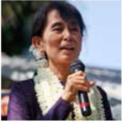
AUNG SAN SUU KYI:

ANNE FRANK: Ik ben vrij als ik mijn eigen ideeën kan hebben en mezelf kan zijn.